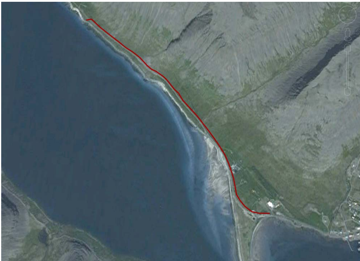
Mynd 4-3. Mynd sem sýnir legu fyrirhugaðar lagnar að sundlaugarsvæði en þaðan mun lögnin tengjast veitukerfi um kaптúnið. Hönnun á því liggur ekki fyrir en ráðgert er að tengja fyrst sundlaug, grunnskóla og íþróttahús.

„Frá borholu í Sveinseyrarhlíð verður lögð hitaveitulögn meðfram núverandi lögn að kaптúni í Tálknafirði. Um er að ræða rúmlega 4 km langa lögn sem liggja mun að mestu leyti meðfram eldri lögn sem síðan mun fylgja Tálknafjarðarvegi inn í þéttbýlið til þess að minnka rask.“