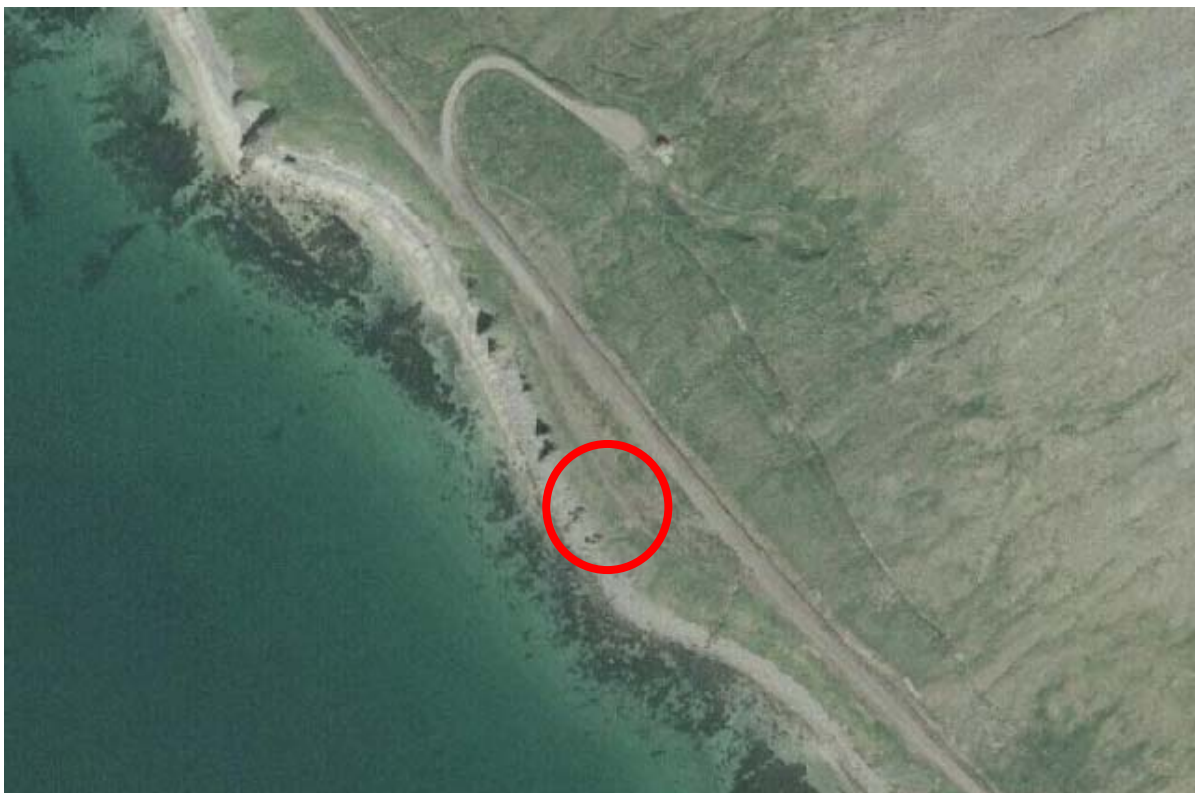
Mynd 6-1. Fyrirhugað borsvæði fyrir heitt vatn er innan rauða hringsins. Um er að ræða raskað graslendi.

Vegurinn í Sellátradal er nokkuð vinsæl útivistarleið og liggja gönguleiðir frá honum upp til fjalla. Framkvæmdasvæðið sjálft er innan svæðis sem skilgreint er í gildandi aðalskipulagi sem landbúnaðarsvæði.